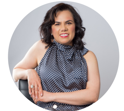
YOI Eventos empresariales